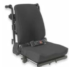
Rücken: ARJ 2174, 2175